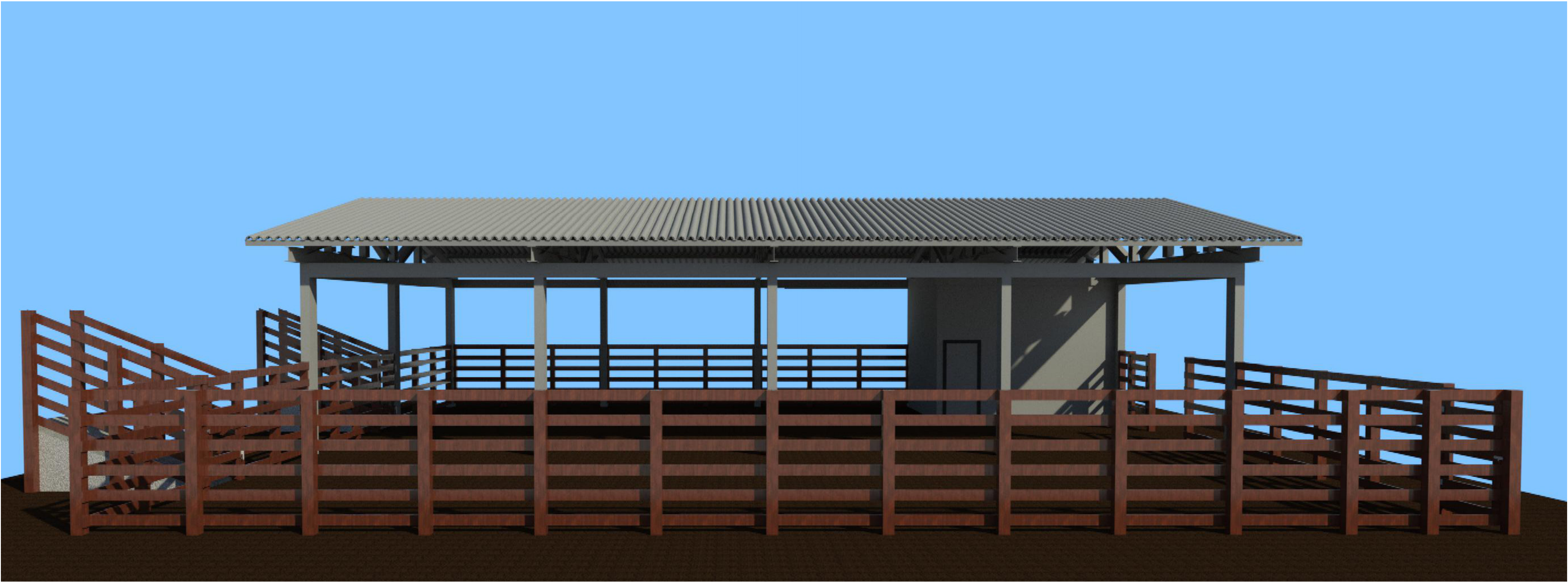
3 Vista lateral 1 : 1