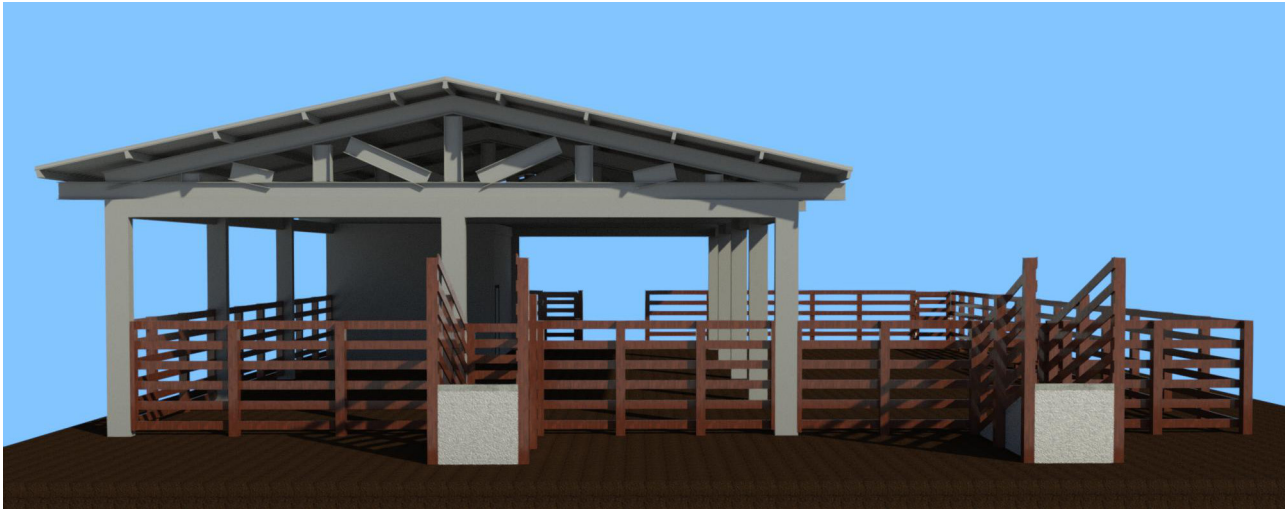
2 Vista frontal 1 : 1