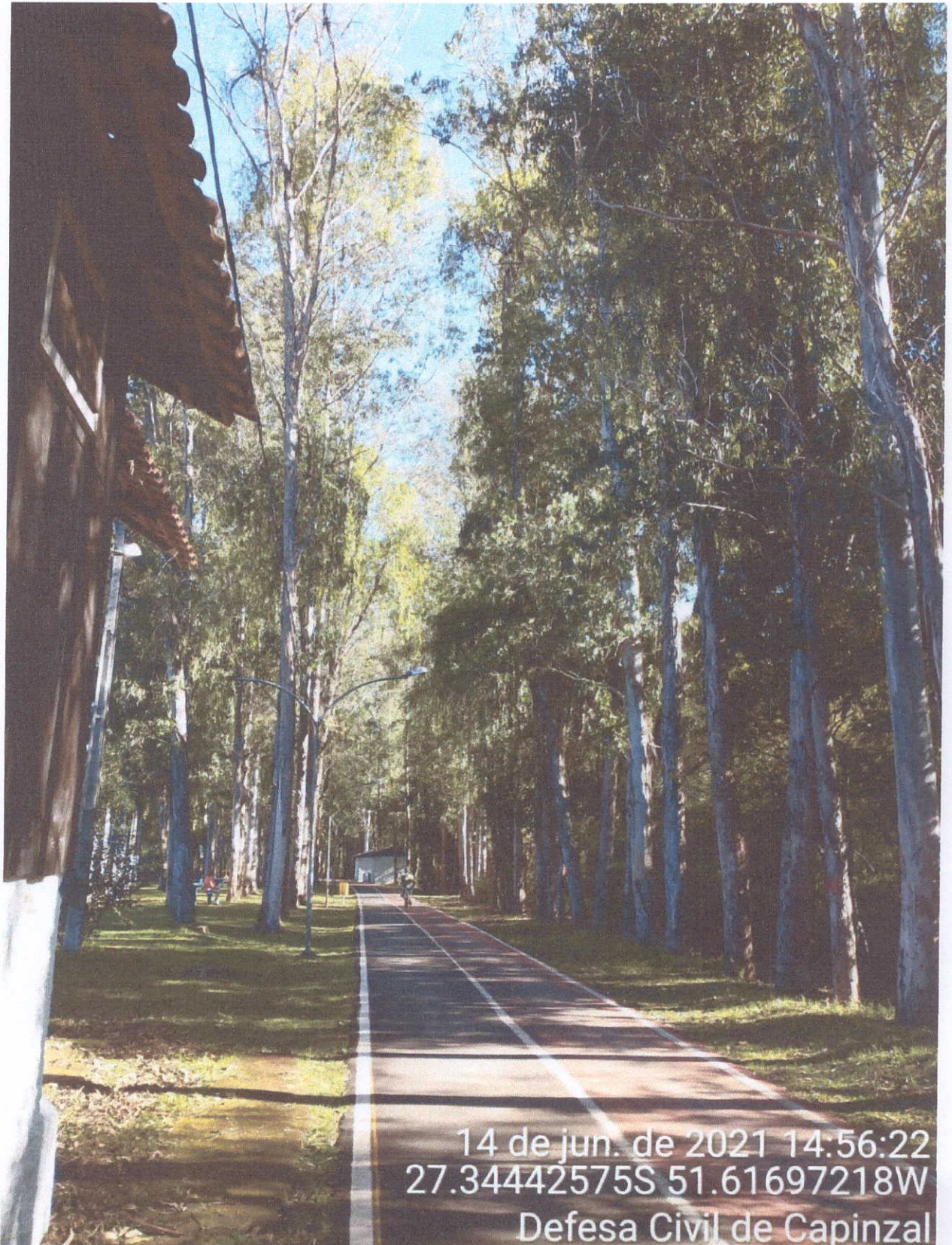
Fotografia 01 - Local que se pretende remover as árvores mortas