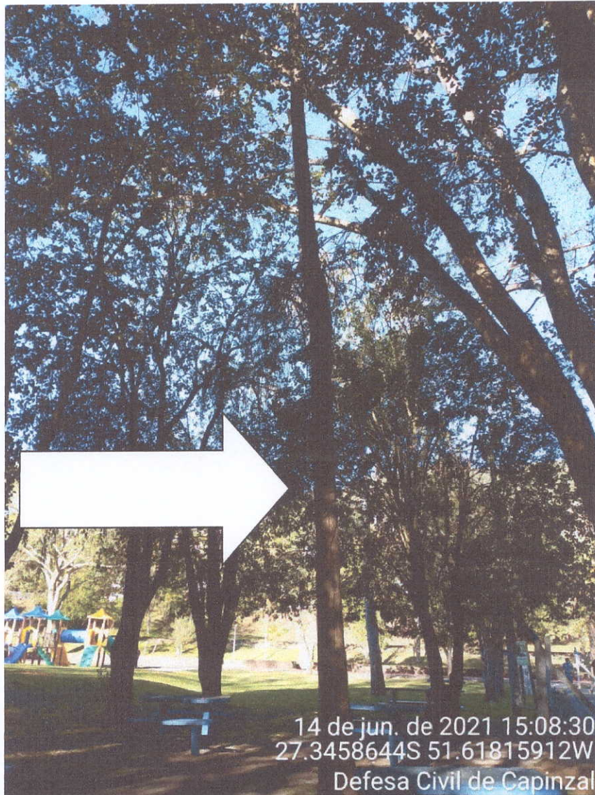
Fotografia 05- Eucalipto morto

Estado de Santa Catarina - Municipio de Capinzal Coordenadoria Municipal de Defesa Civil - COMPDEC