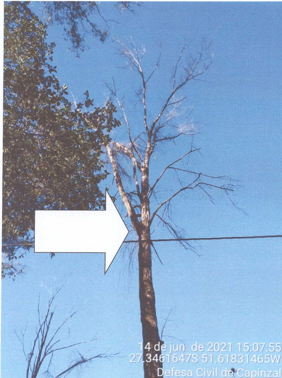
Fotografia 04- Eucalipto morto

Estado de Santa Catarina - Município de Capinzal Coordenadoria Municipal de Defesa Civil - COMPDEC