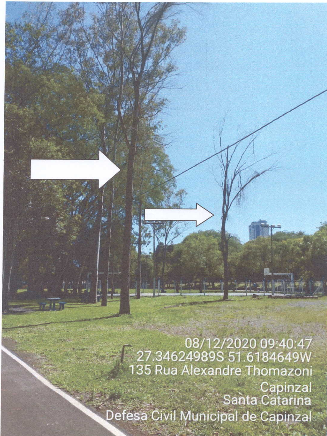
Fotografia 02 – Árvores mortas

Estado de Santa Catarina - Município de Capinzal Coordenadoria Municipal de Defesa Civil - COMPDEC