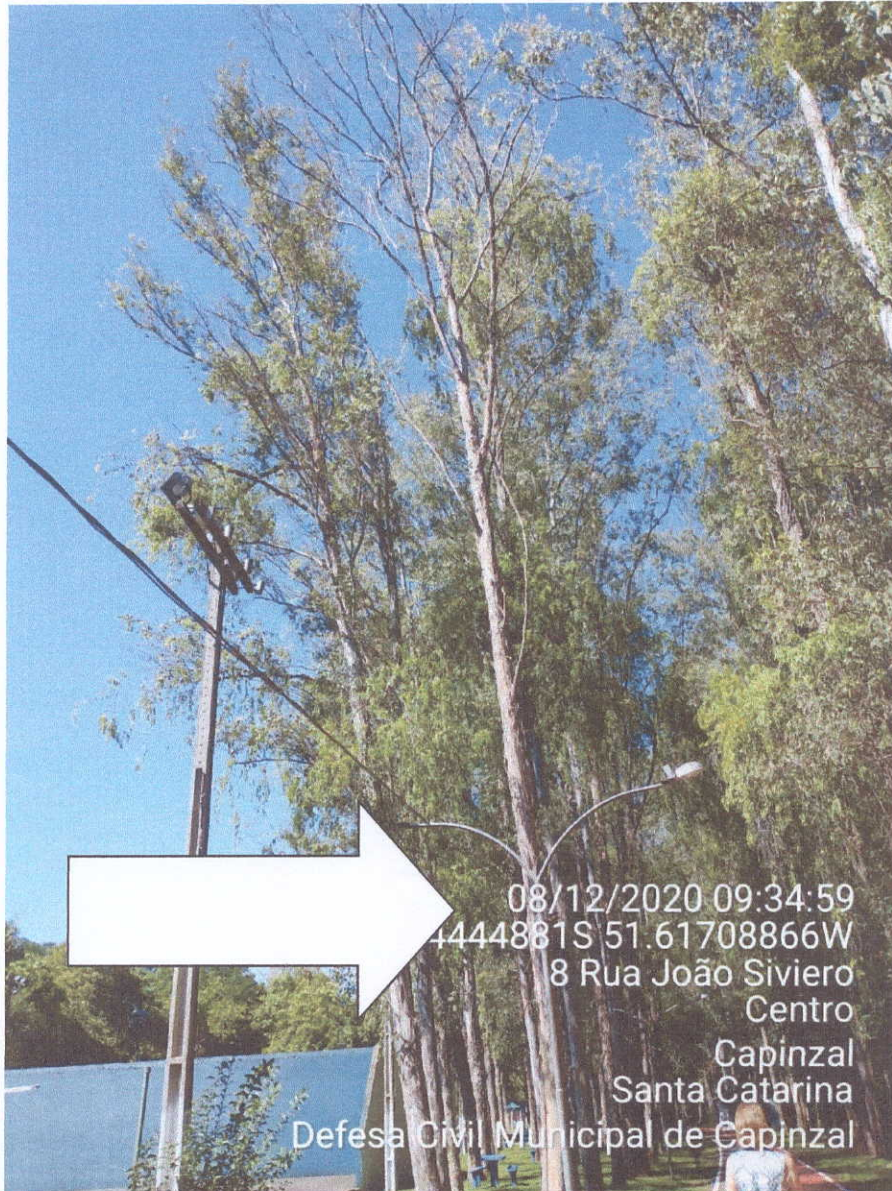
Fotografia 04- Árvore morta

Estado de Santa Catarina - Município de Capinzal Coordenadoria Municipal de Defesa Civil - COMPDEC