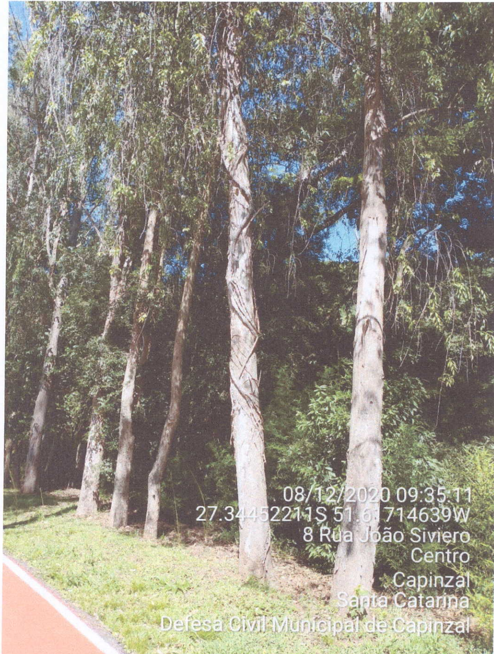
Fotografia 03 – Presença dos cipós erva de passarinho

Estado de Santa Catarina - Município de Capinzal Coordenadoria Municipal de Defesa Civil - COMPDEC