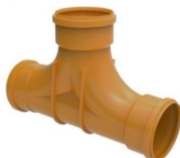
Til para ligação única.