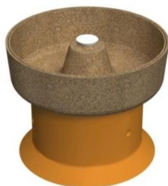
Tampa para Til

CNPJ: 82.782.079/0001-14 Fone/fax: (049) 3555 1107