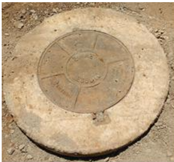
Figura 4.2-1- Modelo de Tampa de PV

Está previsto para esta etapa da obra e execução de 69 PV's.