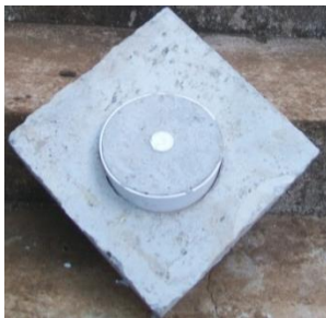
Tampa para Til acoplada no concreto.