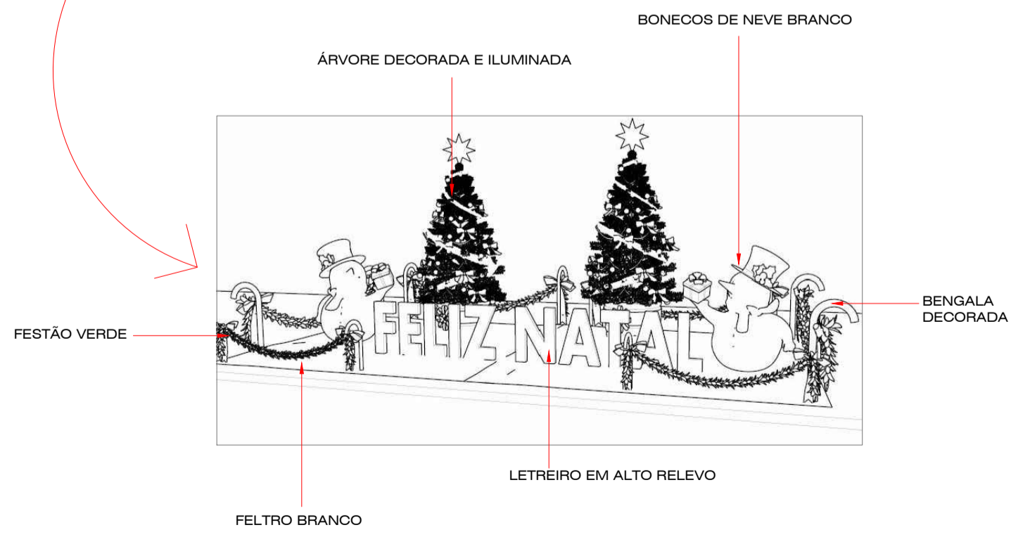
MODELO CENÁRIO ESCALA: 5/E